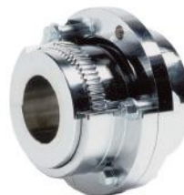
FALK Зубчатые муфты